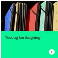
Test og kortlægning