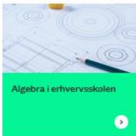
Algebra i erhvervsskolen