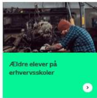
Ældre elever på erhvervsskoler