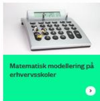
Matematisk modellering på erhvervsskoler