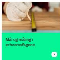
Mål og måling i erhvervsfagene