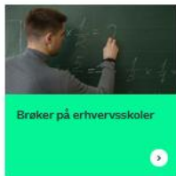
Brøker på erhvervsskoler