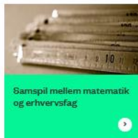
Samspil mellem matematik og erhvervsfag